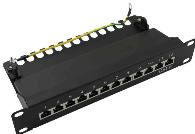
10" Patch Panel Kat. 6, schwarz