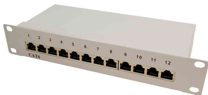
10" Patch Panel Kat. 6, lichtgrau