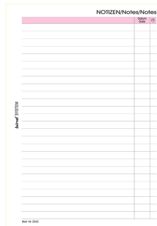
Ersatzeinlagen Notizblätter, liniert