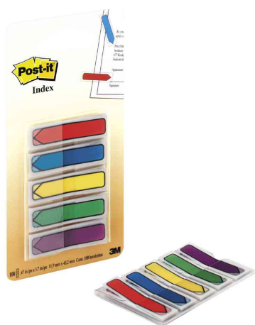
Haftstreifen Index Pfeile (9006041)