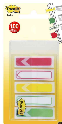
Haftstreifen Index Pfeile (9082921)